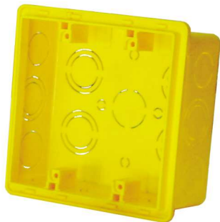
CT44 Caja Cuadrada CT22 Caja Mignon

Soporte CTSO para luminarias: soporta hasta 50 kg a 90°C